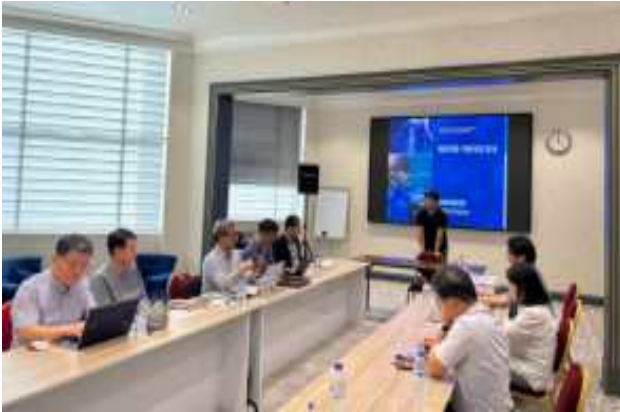
KTR 인증지원 사업 안내