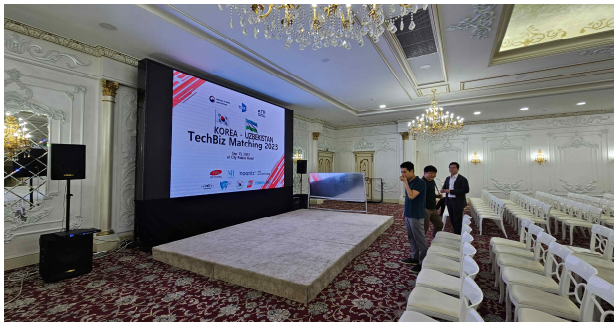
주요 행사장 사전 점검