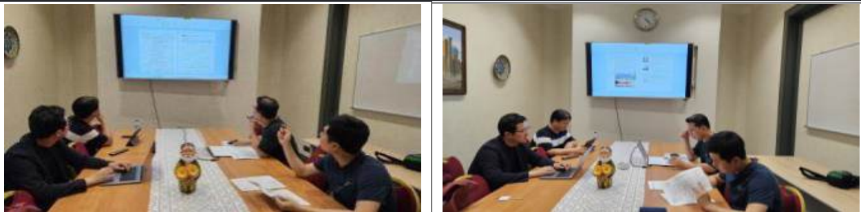
선발대 사전준비 회의