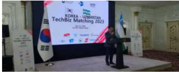
TIPA 본부장 개회사