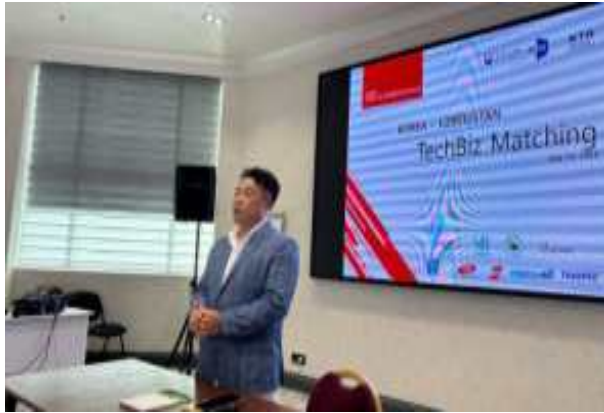
우즈벡 한인회장 간담회