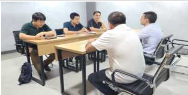
U-ENTER 방문 회의 및 견학 사진