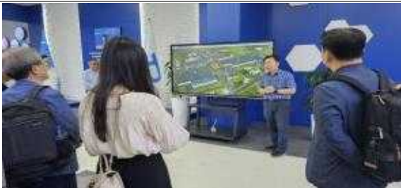
현지 유관기관 우즈벡 테크노파크 방문