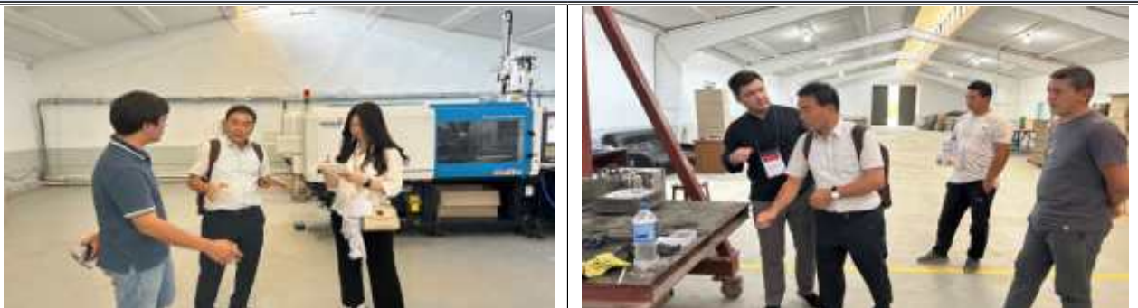
현지 매칭기업 방문