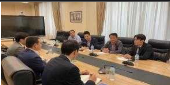
우즈벡 투자산업통상부 미팅