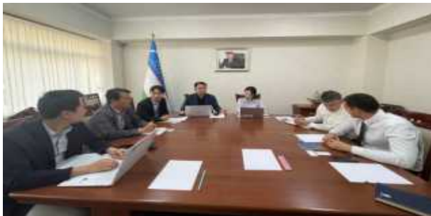
우즈벡 농업자원부 방문