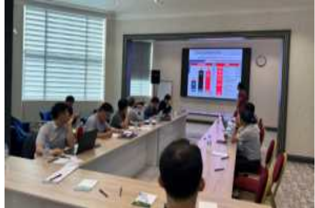
해외기술교류 지원사업 안내