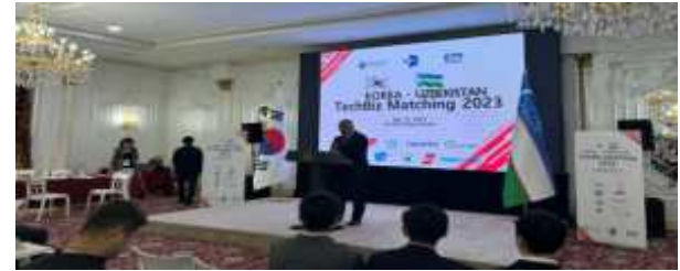
우즈벡 투자진흥청장 환영사