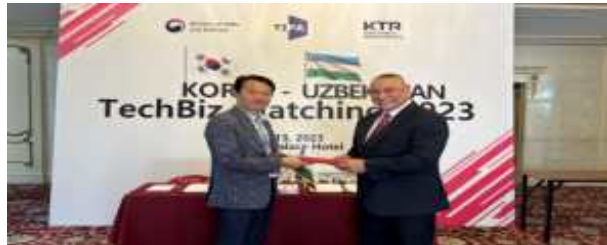
한-우즈벡 기관 간 사진촬영