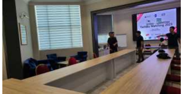
사전 준비 회의(업무보고)